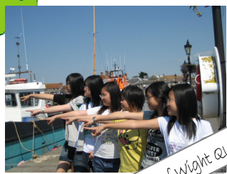
Isle of Wight QUEEN