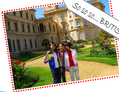
So so so... BRITISH!